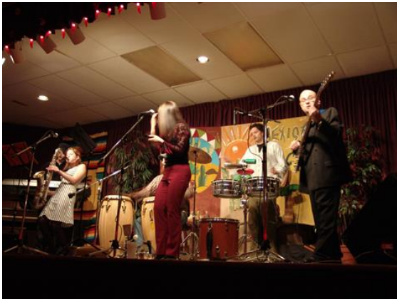
Le spectacle du souper international aux couleurs du Mexique.