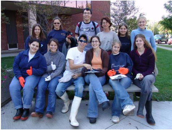
On se prépare à faire le ménage du rivage.