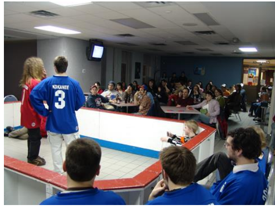
La soirée d'improvisation à la cafétéria du campus.