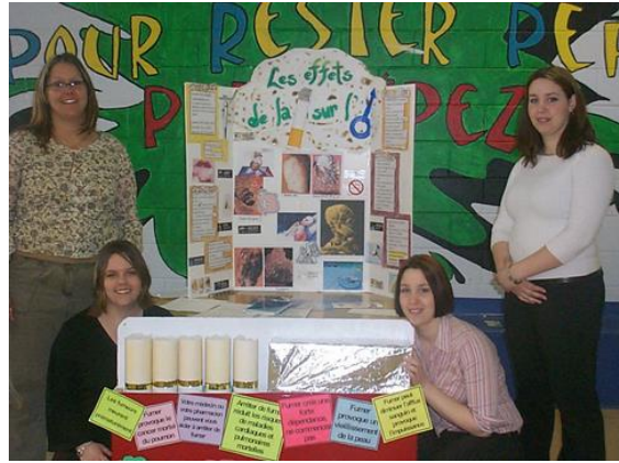
Présentation d'une équipe en science infirmière.