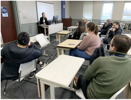
Les volontaires se préparent à tenir leur rôle.