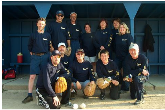
Équipe de balle-molle du personnel de l'UMCS dans le cadre du tournoi de la rentrée.