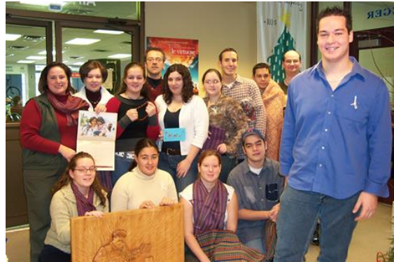
Un groupe d'étudiantes et étudiants se prépare à un voyage humanitaire au Pérou.