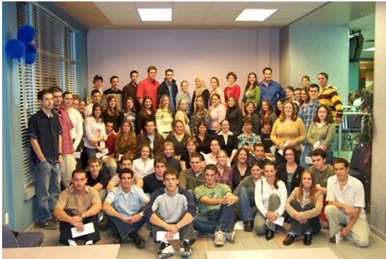
Les boursières et boursiers 2003-2004.