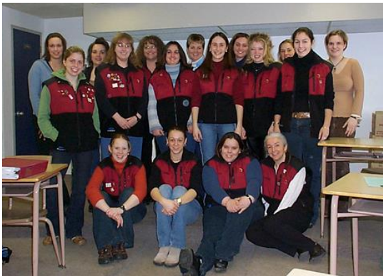
L'équipe de bénévoles du Secteur science infirmière aux Jeux du Canada.