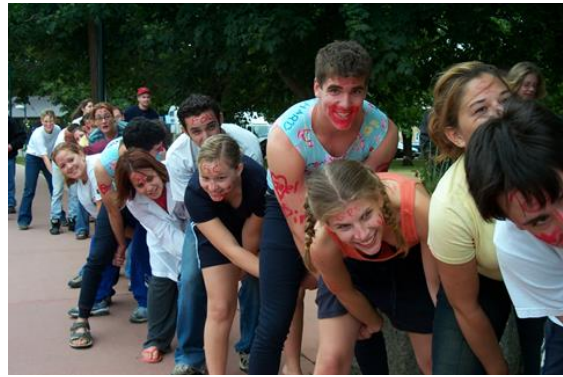
Une activité d'initiation (brise-glace)