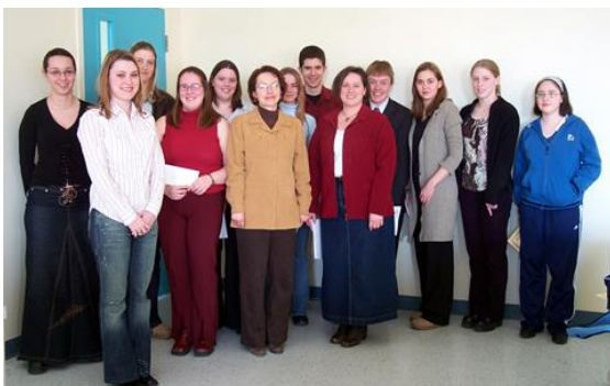
Les gagnantes et gagnants du Colloque scientifique.

Ci-dessous, des photos souvenirs de l'année 2002-2003 à l'UMCS.