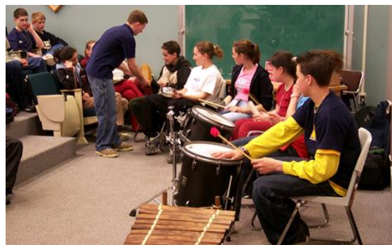
Une pause musicale dans le cadre du concours de mathématiques.