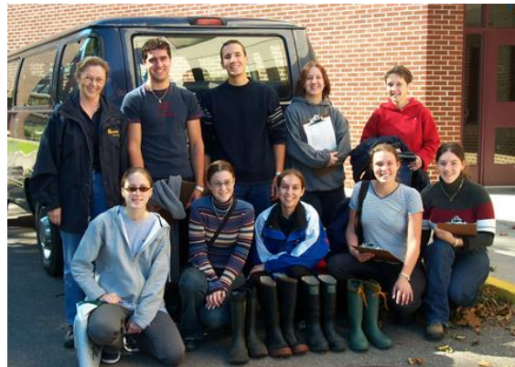
Une sortie terrain en biologie.