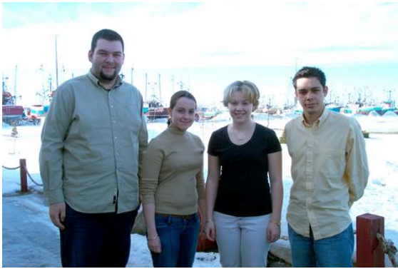
Le comité directeur de l'AÉUMCS.