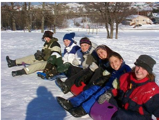
Des étudiantes en science infirmière participaient à l'activité de glisse sur la butte du collèe.