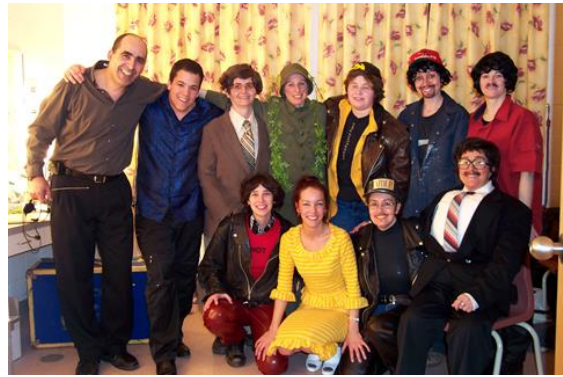
Les comédiennes et comédiens de la troupe de théâtre amateur de l'UMCS.