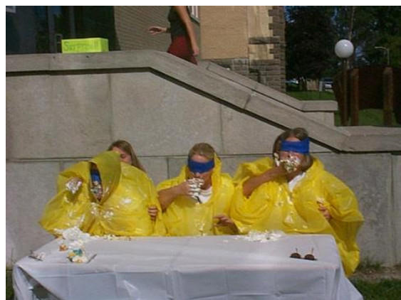
Activité d'initiation (brise-glace) au Secteur science infirmière de l'UMCS, site de Bathurst.