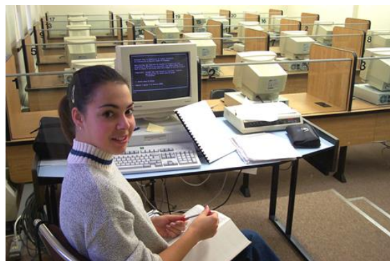
Une étudiante employée au laboratoire de langues.