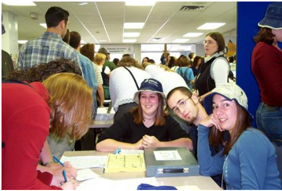
L'équipe de l'AEUMCS accueille les étudiantes et étudiants dans le cadre de la rentrée 2000.