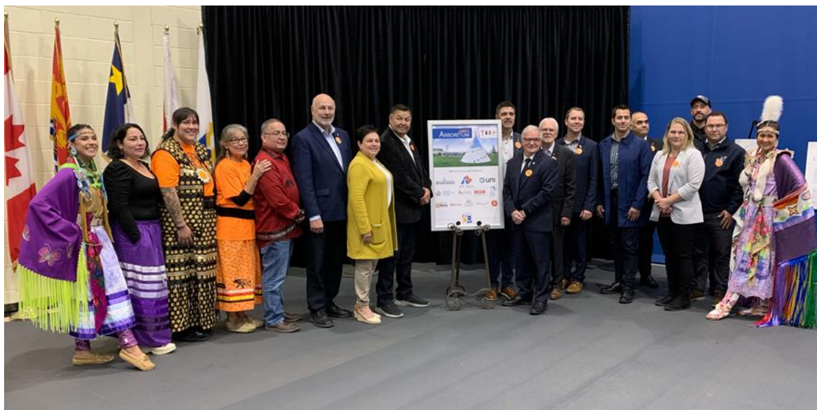
ARBORÉTUM | Photo de l'inauguration de l'Arborétum incluant les personnes représentantes des partenaires.