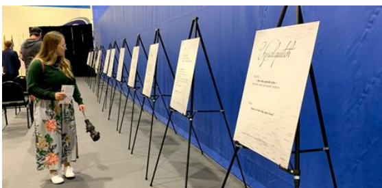
ARBORÉTUM | Les invités ont particulièrement apprécié l'exposition d'affiches toponymiques.

Etre sous les feux de la rampe. Au pied de e lettre. Dans ce cas, les yeux ouverts. Dire