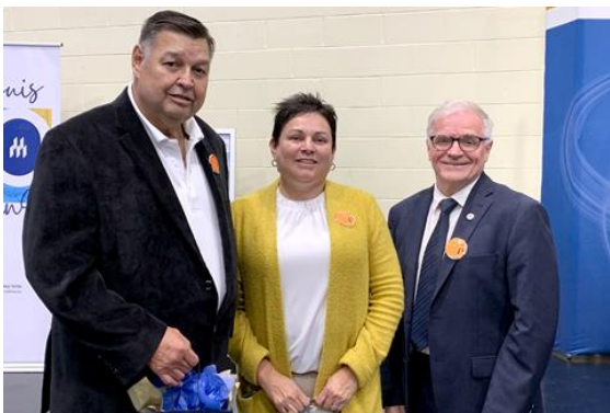
ARBORÉTUM | Le recteur et vice-chancelier a profité de l'occasion pour remettre un cadeau au chef Paul ainsi qu'à son épouse.