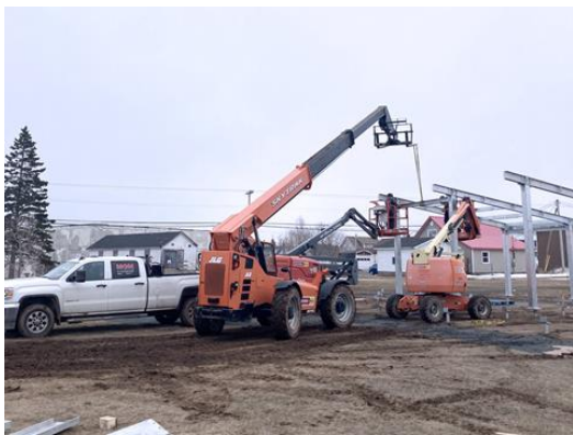
ARBORÉTUM | La machinerie à l'œuvre.