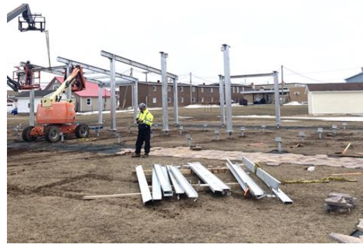
ARBORÉTUM | On commence à ériger les structures.