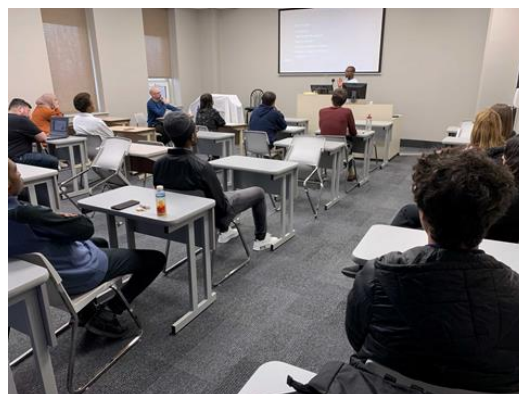
COLLOQUE SCIENTIFIQUE ÉTUDIANT 2023 | Présentation des projets dans la salle 308 SIL.