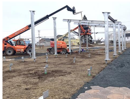
ARBORÉTUM | Ça commence à prendre forme.