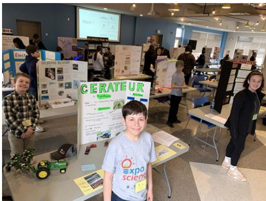
EXPO-SCIENCES | Les élèves sont fiers de présenter leurs travaux.