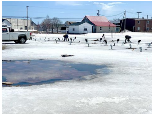
ARBORÉTUM | Après un hiver plutôt long, les travaux pour la mise en place d'un arborétum à l'UMCS ont repris. L'automne dernier, des sentiers ont été aménagés et l'on a procédé à la plantation d'arbres. Le projet prendra forme rapidement d'ici la fin de l'été.