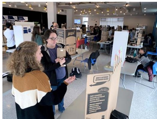
EXPO-SCIENCES | Les juges ont été impressionnés par les présentations.