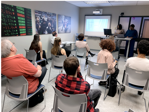
SOIRÉE DE RÉSEAUTAGE | Des étudiantes et étudiants des trois campus de l'Université de Moncton présentaient une étude de faisabilité sur le chauffage des serres à la biomasse, hier, dans le cadre des soirées de réseautage à l'UMCS.