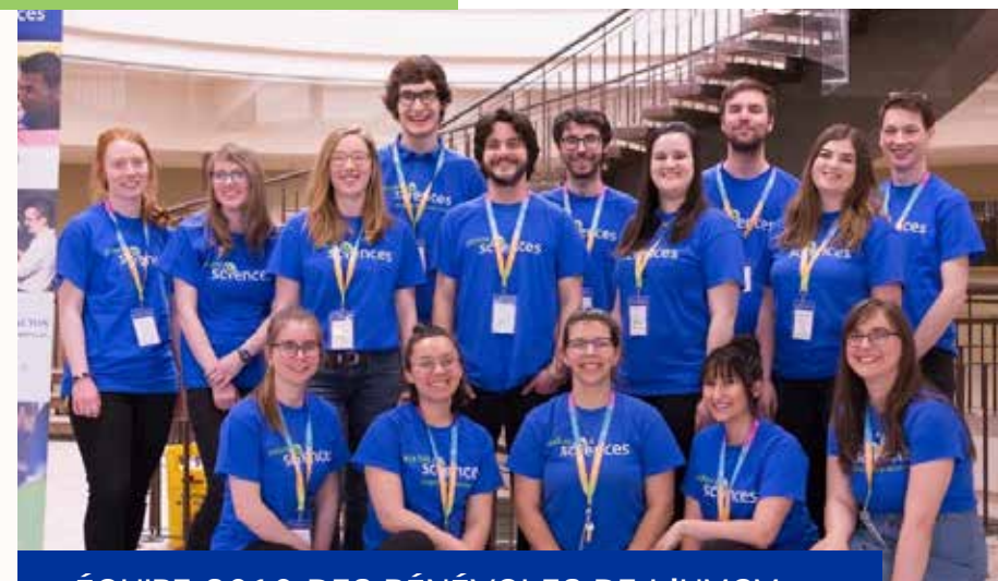
ÉQUIPE 2019 DES BÉNÉVOLES DE L'UMCM