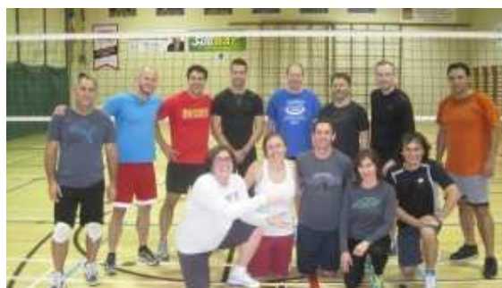
La photo nous montre les participantes et participants à la partie de volleyball social du mardi 27 septembre.

Le Comité propose des activités en encourageant la population universitaire à y participer gratuitement, librement et en grand nombre, peu importe les niveaux d'habiletés.