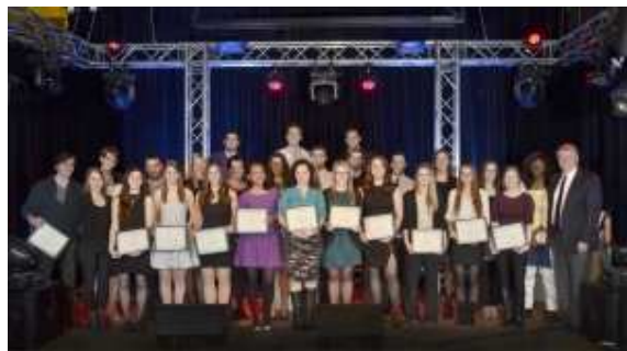
La photo nous fait voir les récipiendaires des meilleurs rendements.

Tenue le 25 février dernier, la soirée des mérites de la Faculté des sciences de la santé et des services communautaires (FSSSC) a permis de reconnaître les étudiantes et les étudiants qui se sont distingués grâce à leur rendement universitaire exemplaire et à leur implication, que ce soit dans la vie étudiante ou comme bénévole au sein de la communauté.