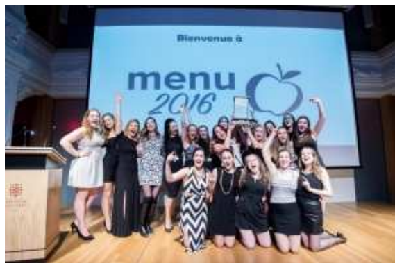
La photo nous fait voir l'équipe de l'Université de Moncton aux Jeux de la nutrition MENU.

Chaque année, les Jeux de la nutrition MENU (Meeting des étudiants en nutrition) ont lieu dans une des quatre universités francophones canadiennes qui offrent un programme de nutrition (Université Laval, Université de Moncton, Université de Montréal et Université d'Ottawa). Cette année, les jeux ont eu lieu du 18 au 20 mars à l'Université Laval.