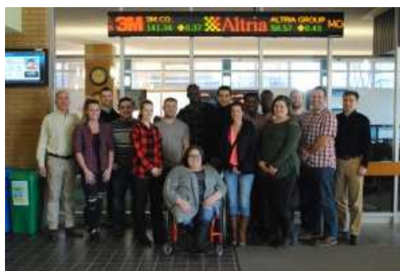
La photo nous fait voir le groupe d'étudiantes et d'étudiants du CCNB Dieppe qui a visité récemment la Salle des marchés de l'Université de Moncton.

Grâce à un partenariat entre le l'Université de Moncton et le CCNB Dieppe, les étudiantes et étudiants du collège sont admissibles à poursuivre leurs études au programme de Baccalauréat en gestion des services financiers de la Faculté d'administration. Ils se voient reconnaître automatiquement 60 crédits et peuvent donc compléter leur programme en deux ans.