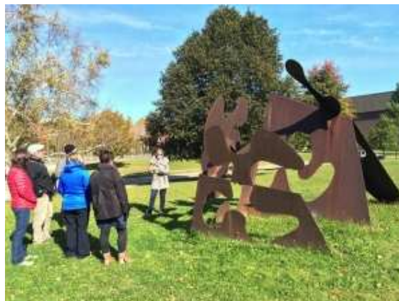
Photo prise le 21 octobre lors de la visite guidée des œuvres d'art sur le campus avec la guide Suzanne Lapointe.

Plus d'une centaine de personnes ont gracieusement rempli le sondage «Comment ça va? 2015 » du CMU. Vous pouvez lire un résumé des résultats sur le site web du CMU.