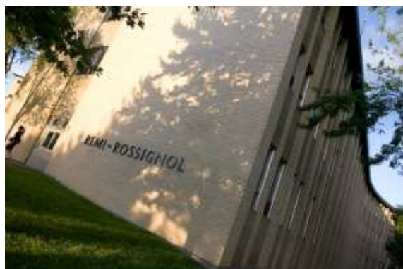
Le pavillon Rémi-Rossignol qui fête ses 50 ans en 2015.

À l'occasion du 50e anniversaire du pavillon Rémi-Rossignol qui abrite la Faculté des sciences, le Musée acadien de l'Université de Moncton présente l'exposition temporaire intitulée Demi-siècle de sciences en Acadie - le 50e du pavillon Rémi-Rossignol , jusqu'au dimanche 20 décembre 2015.