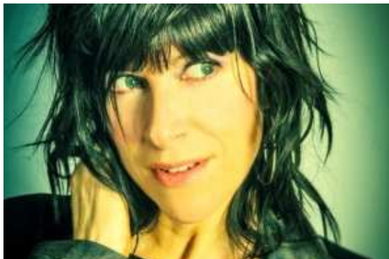
L'interprète Luce Dufault qui sera en spectacle le 23 octobre.