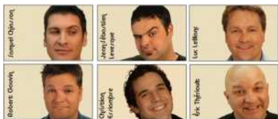
Les humoristes qui présenteront le S.I.M.

Le 52e anniversaire de fondation de l'Université de Moncton sera souligné le vendredi 19 juin lors d'une fête organisée à l'intention des membres du personnel.