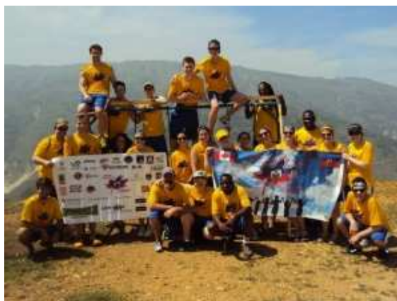
La photo prise en Haïti nous fait voir les membres de la Mission humanitaire Haïti 2015 de l'Université de Moncton.

La délégation a également parrainé et fourni l'équipement à huit équipes pour un tournoi de soccer U-14. Plusieurs parties amicales entre adultes provenant du Canada et d'Haïti ont aussi eu lieu. De plus, des rénovations ont été effectuées à l'abattoir de la communauté. Ce projet micro-économique a été financé et complété grâce à l'aide de la délégation et grâce à des généreux dons de la communauté.