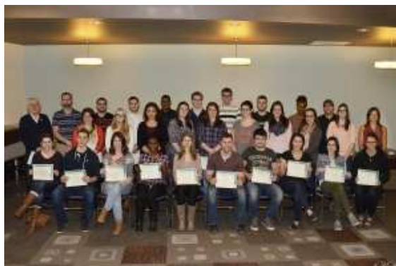
La photo nous fait voir des participantes et participants au Projet-impôt 2015.

Par ailleurs, l'Agence du revenu du Canada, Bureau de Saint-Jean NB, a tenu à reconnaître la participation d'une cinquantaine d'étudiantes et d'étudiants au Projet-impôt en leur remettant un certificat de l'Agence.