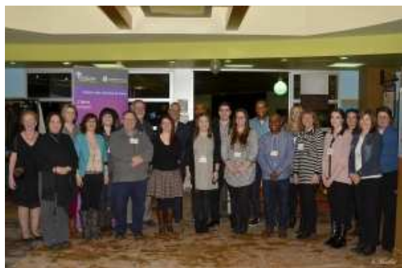
La photo nous fait voir quelques personnes présentes au 5 à 7 annuel du DAP.

Lors d'un 5 à 7 tenu le 19 février dernier au café étudiant Le Coude, près de 45 professeurs, professeurs, diplômées, diplômés et étudiantes et étudiants actuels et futurs en administration publique et en gestion des services de santé se sont rassemblés. Organisée par le Département d'administration publique (DAP), en partenariat avec l'alUMni et le CNFS -Volet Université de Moncton, cette activité de réseautage a été l'occasion de tisser des liens dans une atmosphère conviviale.