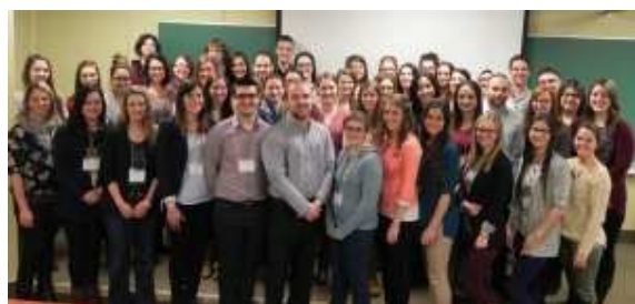
La photo prise lors de la formation « Sauvons Sophie samedi » tenue le 7 février nous fait voir les participantes et les participants.

médecine, kinésiologie, nutrition et psychologie, cette activité a permis aux participantes et aux participants d'en apprendre davantage sur la collaboration dans le domaine de la santé, sur l'offre active de services de santé en français et sur leur rôle comme futurs professionnels.