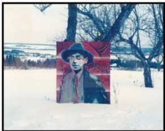
Paul Édouard Bourque, Mikey, 1982, électrophotographie et techniques mixtes sur papier marouflé sur masonite, 122 x 103 cm.

La Galerie d'art Louise-et-Reuben-Cohen présente l'exposition Les Mikeys de Paul Édouard Bourque jusqu'au 4 avril 2015.