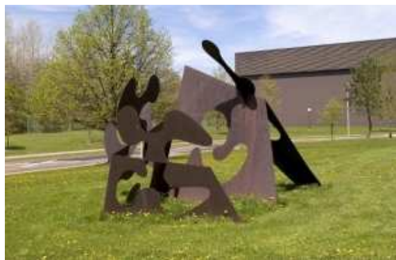
Œuvre de Claude Roussel, Éros Corten , 1971, acier Corten, 274 X 559 X 213 cm.

Jusqu'au 1 février 2015, la Galerie d'art Louise-et-Reuben-Cohen de l'Université de Moncton présente l'exposition Claude Roussel : Éros et transfiguration , organisée par Paul Édouard Bourque, commissaire invité.