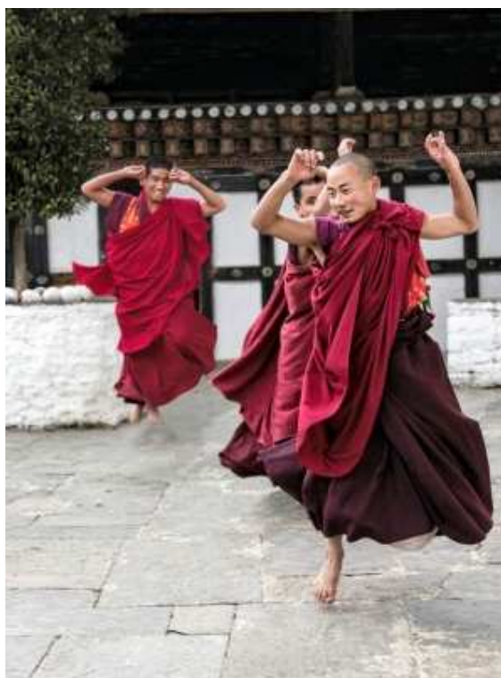
Photographie prise par Martine Michaud au Bhoutan.