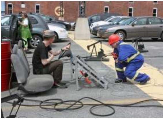
Performance de Rita McKeough intitulée Alternator (2008)

partir de midi. Ces activités sont gratuites et ouvertes au public.