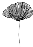
FLEURS ET PLANTES

*AUTRES MATÉRIAUX ORGANIQUES TROUVÉS LORS DE LA CUEILLETTE