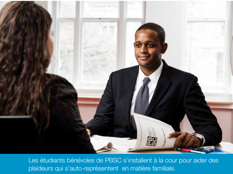
Les étudiants bénévoles de PBSC s'installent à la cour pour aider des plaideurs qui s'auto-représentent en matière familiale.

133 ÉVÉNEMENTS SUR LES CAMPUS ET PROGRAMMES ORGANISÉS CHAQUE ANNÉE