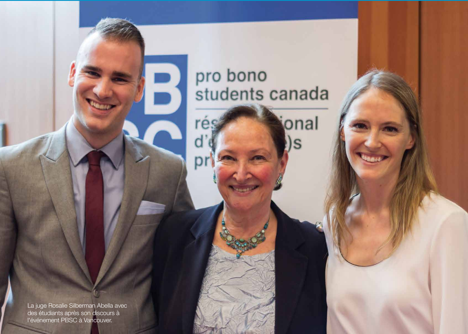
La juge Rosalie Silberman Abella avec des étudiants après son discours à l'événement PBSC à Vancouver.