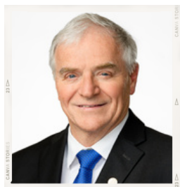
DR DENIS PRUD'HOMME

Ses recherches portent sur les effets de l'activité physique, de la nutrition et de la médication chez des personnes vivant avec l'obésité, le syndrome métabolique, le diabète ou des troubles de santé mentale. Plus récemment, il s'intéresse à l'impact des barrières linguistiques sur la qualité et la sécurité des soins offerts aux communautés francophones en situation minoritaire.