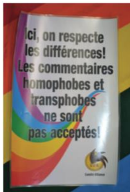
Affiche créée par l'Alliance de l'école Louis-J-Robichaud de Shédiac.

Une personne élève d'une école secondaire francophone du Nouveau-Brunswick