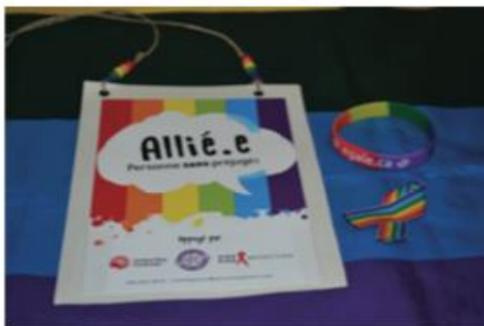
Une affiche produite par le programme Sain et Sauf de Sida Montréal.