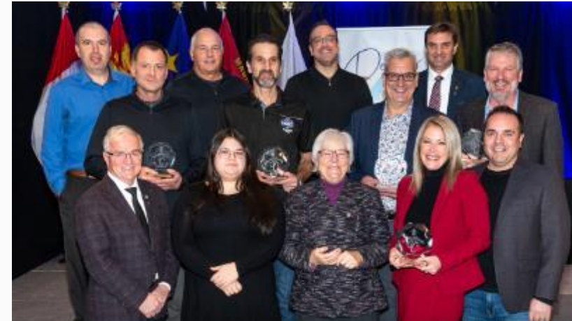
Ordre de la Chancelière - Edmundston