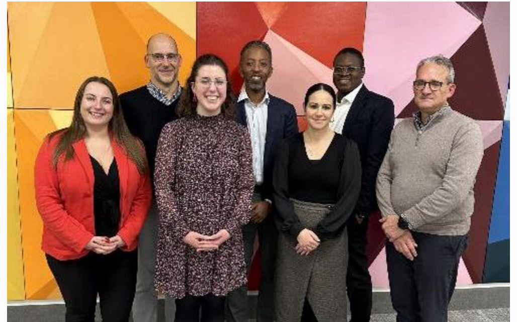
Nouveau conseil d'administration de L'alUMni