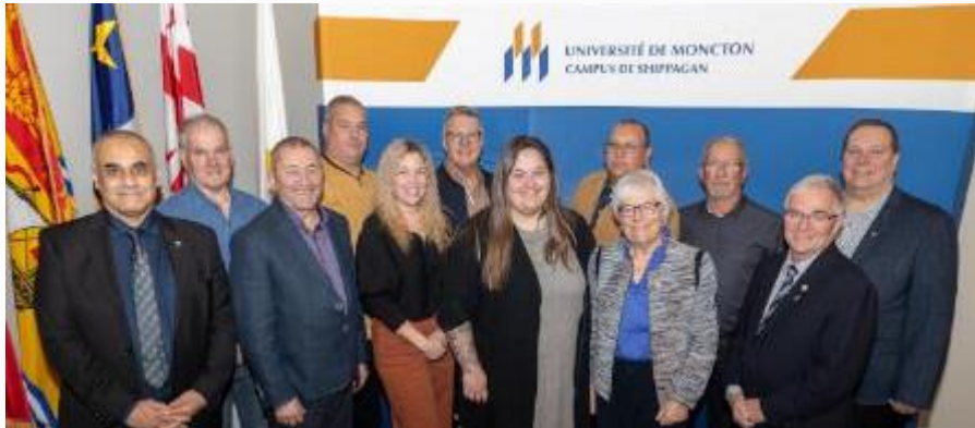
Ordre de la Chancelière - Shippagan