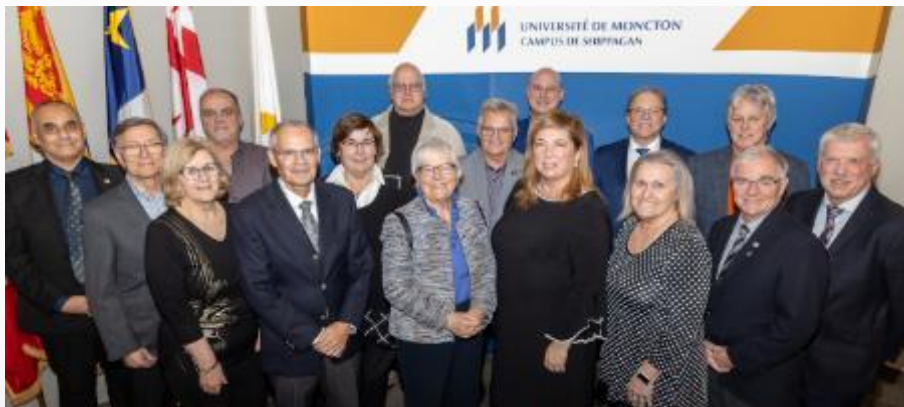
Ordre des Régentes et Régents - Shippagan