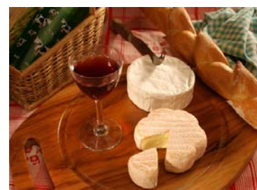
La cuisine française