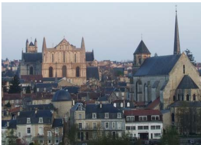
Vue de Poitiers

Surnommée à juste titre la « Ville aux cent clochers », elle abrite dans son centre 82 monuments classés et protégés par la législation sur les Monuments Historiques.